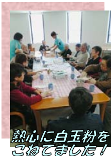
熱心に白玉粉をこねてました！