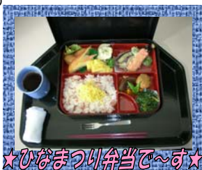
★ひなまつり弁当で～す★