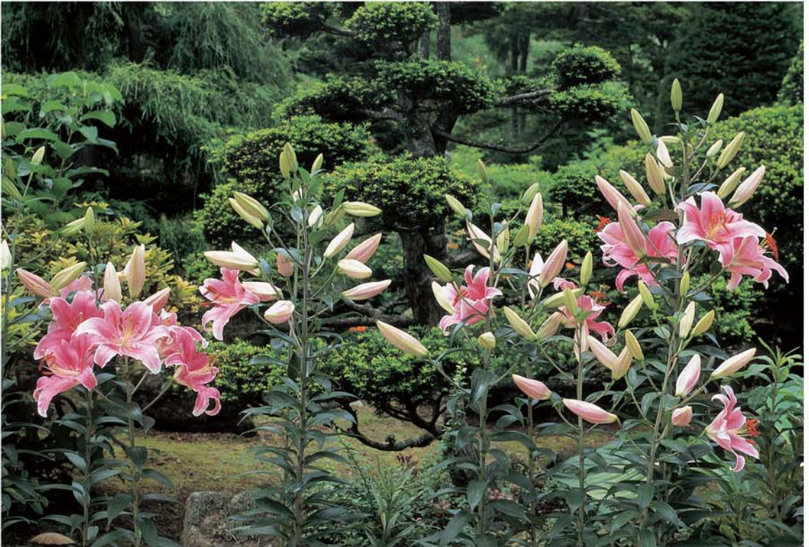
「百合の咲く庭園」