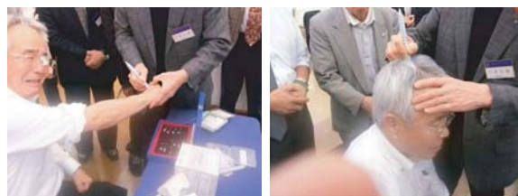
三品会長エレクトが、実技に参加！痛ーい！！