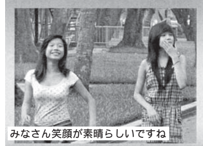
みなさん笑顔が素晴らしいですね