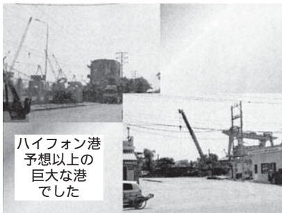
ハイフォン港 予想以上の 巨大な港 でした

それでは、どんな日本企業が進出しているか？代表的なところでブリヂストンであります。多くのベトナム人を雇用しております。次にベトナムのコスト面を調べてみました。電気料金は1kwh当り9円(日本は20円)水道料金は1m 3 当り30円~60円であります。ベトナムの人件費は、大卒はエンジニア、高卒はワーカーと決まっています、ワーカーは15,000円、エンジニアは35,000円~50,000円となっております。ベトナムの人口は、約1億人に近い将来になります。日本と違ってベトナムは、人口がどんどん増えているのが現況です。