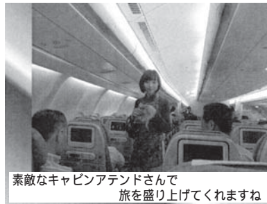
素敵なキャビンアテンダンさんで 旅を盛り上げてくれますね