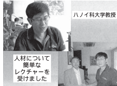
ハノイ科大学教授